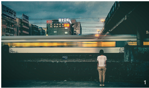
1 孤独的城市：生活在高度人工化和快节奏的城市中的人们有着诸多心理健康问题 Lonely city: residents living in highly artificial and intensive urban environments have a wide variety of mental problems